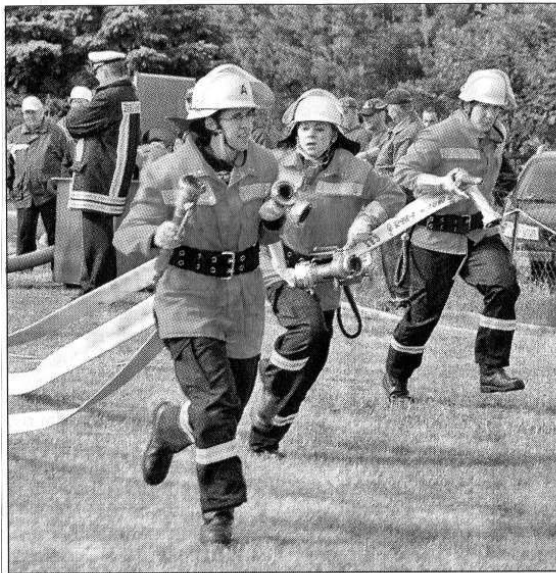
Auch Feuerwehr-Frauen können schnell unterwegs sein. Beim Kreisausscheid brauchten sie sich nicht verstecken.