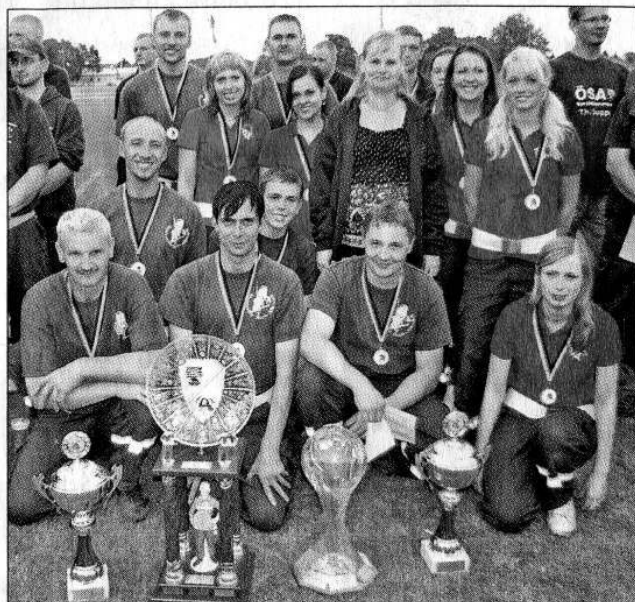
Die Mannschaft aus Buch bei Stendal nahm viele Pokale mit.