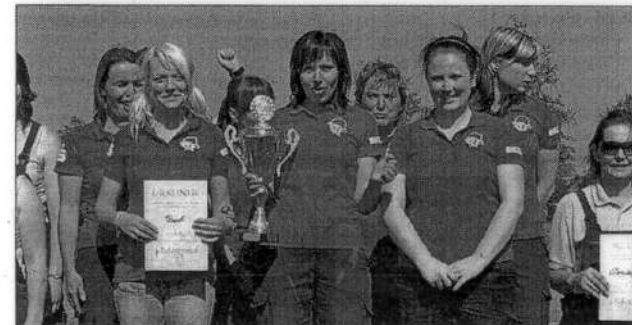
Glücklich mit Platz eins: die Bucher Frauen.

100-Meter-Hindernislauf bringt Buchs Feuerwehrmänner noch auf zwei von drei Treppchen