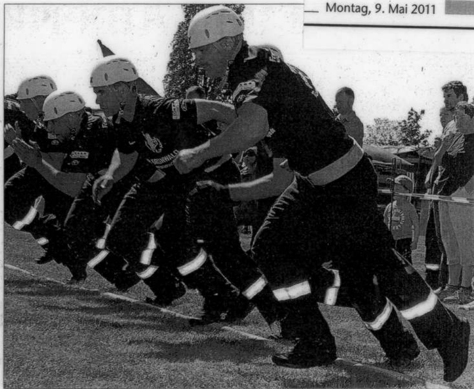
Die Bucher Frauen kurz nach ihrem Start zum ersten Lauf.