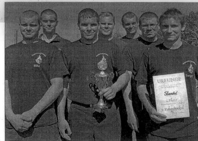
Die Stendaler Kameraden kämpfen sich in diesem Jahr auf Platz drei.